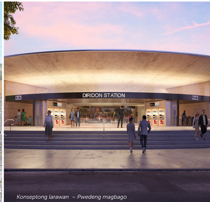
Konseptong larawan – Pwedeng magbago

Iilagay ang Diridon Station sa pagitan ng Montgomery at Cahill Streets, sa gawing timog ng Santa Clara Street. Iilagay kapantay ng kalye ang pagbili ng tiket at ang mga fare gates habang ang concourse at mga stacked platform ay nasa underground (ilalim ng lupa). Sa mga dulong silangan at kanluran ng platform, gagawa ng pang-emerhensyang labasan at mga pasilidad para sa bentilasyon. Malalagay ng mga koneksyon sa pedestriyan sa kasalukuyang Diridon Caltrain Station at sa Diridon Light Rail Station ng VTA pati na sa Diridon Intermodal Station. Isasama ang bahaging istasyon sa kombinasyong pagpapaunlad na nakapalibot dito, kabilang na ang Downtown West ng Google, gagawa ng pinag-isipang mabuting komunidad na nakatuon sa transit.