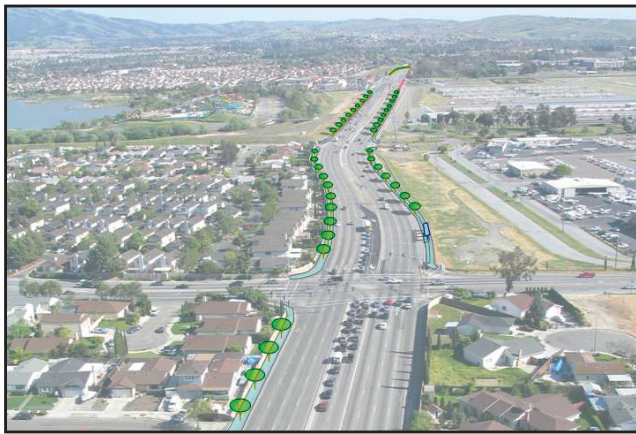
Primera Fase - Mejoras peatonales de Capitol Expressway

Primera Fase del proyecto incluirá mejoras peatonales y en el transporte de autobuses para optimar el acceso y seguridad de los peatones por la carretera rápida de Capitol Expressway. El proyecto incluye nuevas aceras (banquetas), luces exteriores y jardinería de separación entre la acera y la carretera a lo largo de Capitol Avenue hasta Quimby Road. Durante esta primera fase se llevará a cabo la reconstrucción del Centro de Tránsito de Eastridge. Posteriormente, estas mejoras también incluirán nuevas paradas del transporte rápido (rapid transit) y otras mejoras en las calles Story y Ocala como parte del transporte rápido de Santa Clara-Alum Rock a lo largo de Capitol Expressway.