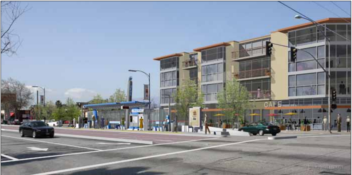
Mô phỏng nhà ga BRT tại Alum Rock Avenue và King Road.