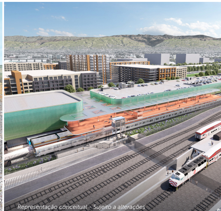
Representação conceitual - Sujeito a alterações

A Estação Santa Clara, adjacente à Estação Santa Clara Caltrain e ao futuro empreendimento Gateway Crossings, será a estação de fim de linha para a Extensão Fase II do BART da VTA. Ao contrário das outras três estações, o terminal será elevado e a plataforma a nível do solo, semelhante à Estação BART de Warm Springs. A estação incluirá estacionamento para veículos, instalações para bicicletas e uma ligação a Caltrain, Capitol Corridor, Altamont Corridor Express e a várias linhas de autocarros da VTA através da passagem pedonal inferior de Santa Clara existente.