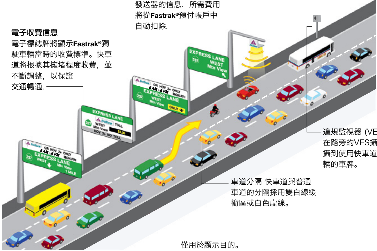
違規監視器 (VES) 安裝在路旁的VES攝像機將拍攝到使用快車道的每輛車輛的車牌。

電子標誌牌將顯示Fastrak®獨駛車輛當時的收費標準。快車道將根據其擁堵程度收費，並不斷調整，以保證交通暢通。